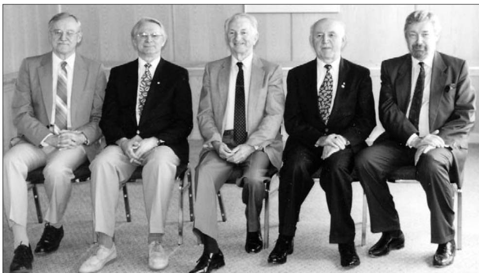
The past presidents of CFUS (1996.)

The Foundation also needs to consider another reality. Some universities will require temporary financial support to enable Ukrainian Studies courses to be initiated. In others, such help will be necessary if Ukrainian courses are to continue. It will be necessary for the Foundation to turn to the Ukrainian community for the funds needed for these and similar purposes if Ukrainian Studies at the undergraduate level are not to disappear completely.